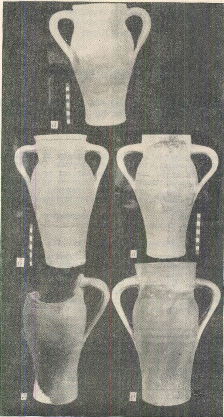
Обр. 1 а, б, в, г, д. Глинени амфори от София