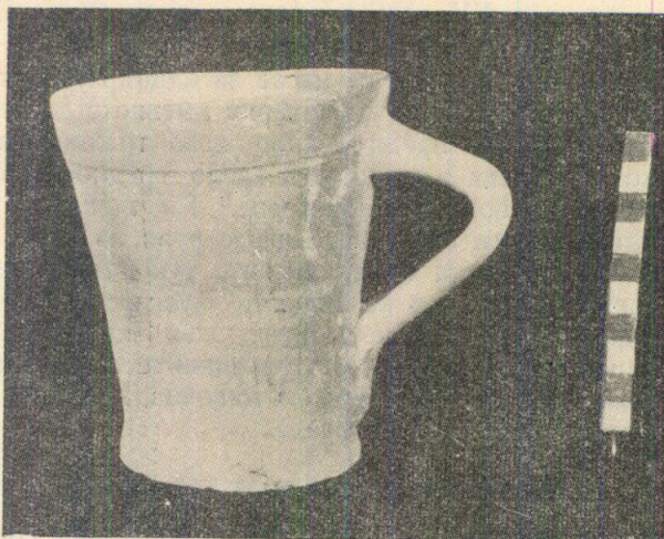
Обр. 2. Глинена чаша от София

По размери и петте съда са почти напълно еднакви. Четирите са високи по 28,5 см, петият е 29,5 см. Диаметрите на устията се движат