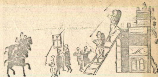
„Византийците обсаждат Преслав“ — древна миниатюра

Според апокрифното „сказание“, бил граден от Симеон цели 28 години. Но не само белокаменните стени, които опасвали Вътрешния и Външния град на Велики Преслав, не само неговата внушителност и мощ смайвали чужденеца, а и изтънченият блясък на църквите и дворците. ... не зная как да разкажа това — само с вашите собствени очи бихте могли достойно да се надивите на тая красота“ — възкликва Йоан Екзарх в своя „Шестоднев“.