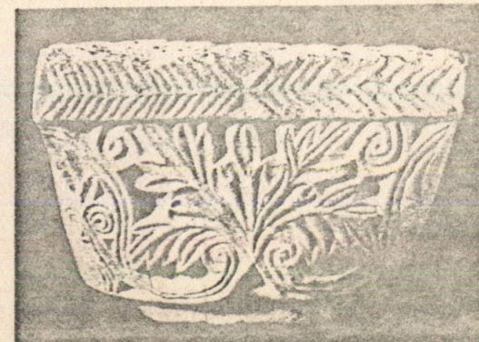
Капител от двореца в Преслав

Като столица Преслав не познава време на упадък. Тя загива в своя разцвет, в разгара на византийската война през 972 г. За кратко време я замества Средец, а после Охрид и Преспа поемат знамето на епичната борба с Византия. Но освобождението от византийско иго възвръщат търновските камбани.