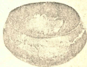
Бронзовият котел след реставрацията